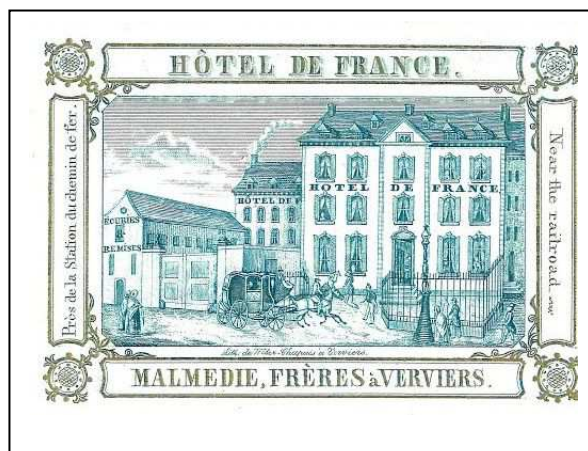
Hôtel de France